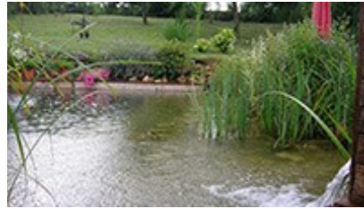
Sous la pluie