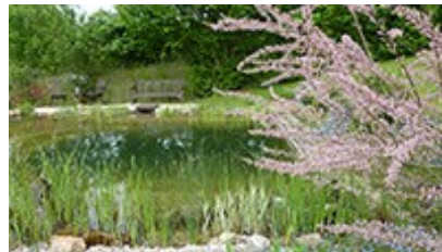
Le coin repos